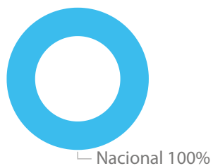
Stock Total por Garantía