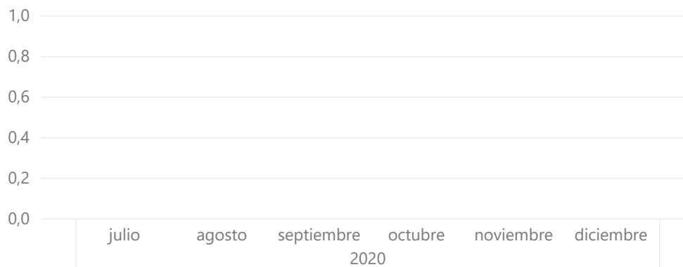
Stock Bonos ME