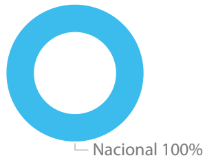
Stock Total por Garantía