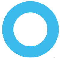
Stock Total por Moneda