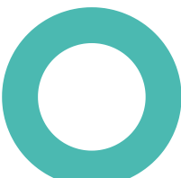
Stock Total por Garantía