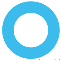
Stock Total por Moneda