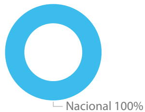
Stock Total por Garantía