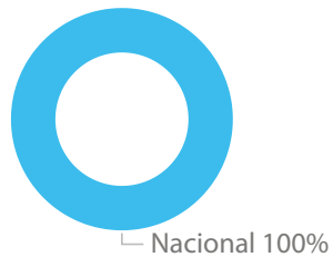
Stock Total por Garantía