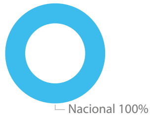
Stock Total por Garantía