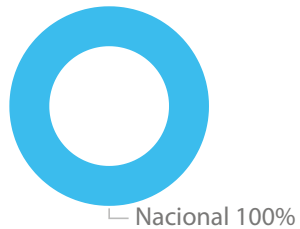
Stock Total por Garantía