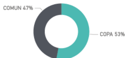
BONOS - Servicios anuales