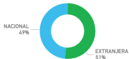
BONOS - Servicios 2021