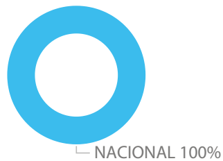
Stock Total por Garantía