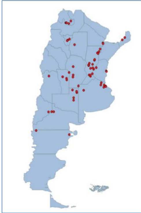
Ilustración 2- Ubicación geográfica de las plantas relevadas.

De las plantas relevadas, el 53,1% de las plantas pertenecen al sector privado, el 37,5% al sector público, y el porcentaje restante pertenece a cooperativas y ONG.