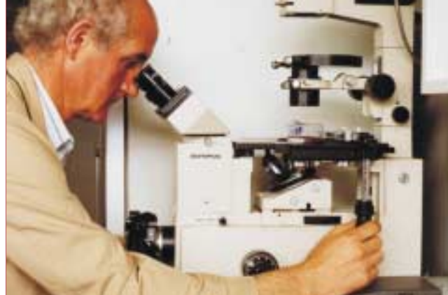
Estudio de alteraciones radioinducidas en cultivos celulares