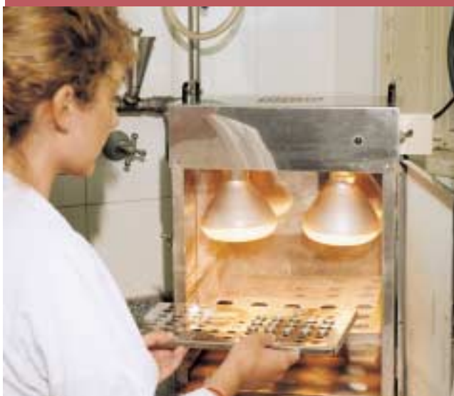
Procesamiento de muestras para la determinación de uranio