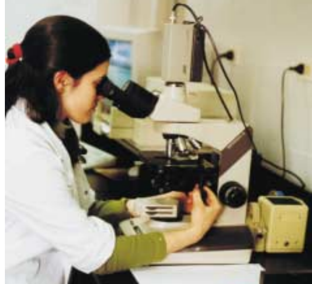
Análisis cromosómico por microscopía óptica

Para desarrollar sus tareas el Laboratorio de Dosimetría Biológica dispone de: