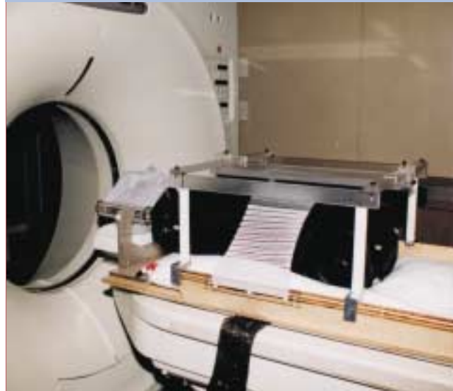
Simulación de un estudio tomográfico: evaluación dosimétrica