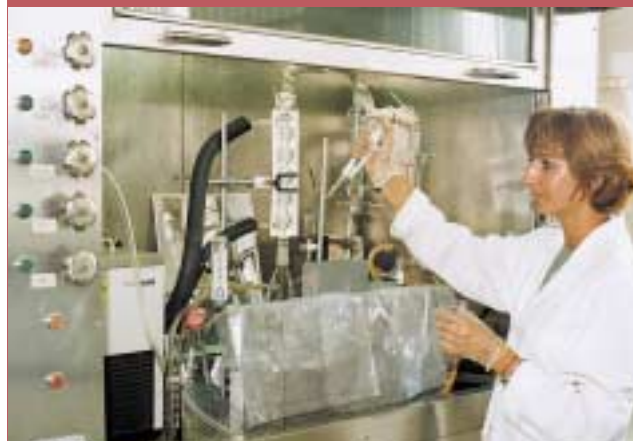
Procesamiento de muestras para la detección de yodo 129