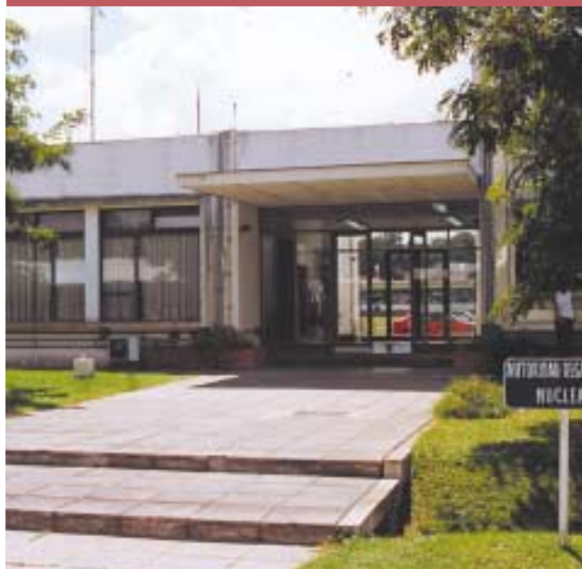
Laboratorios de la ARN

La ARN cuenta con laboratorios e instalaciones ubicadas en el Centro Atómico Ezeiza, partido de Ezeiza, Provincia de Buenos Aires y en su Sede Central que le permiten efectuar mediciones y determinaciones necesarias para cumplir con su función regulatoria. Las principales tareas llevadas a cabo en esta área son: