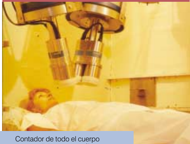
Contador de todo el cuerpo para mediciones específicas