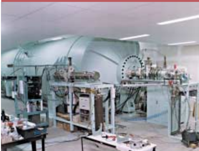
Espectrómetro de masas con acelerador