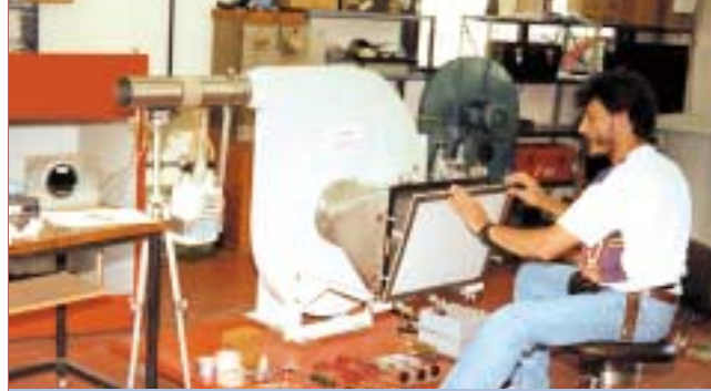
Banco de prueba de filtros