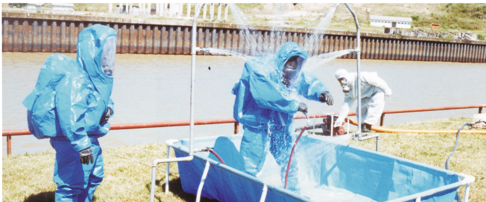
Personal del Servicio de Salvamento de la Armada y de la Base Naval Zárate participan en el Simulacro de accidente en la Central Nuclear Atucha I.

En caso de accidente nuclear un funcionario designado por la ARN será el Jefe Operativo de la Emergencia, a quien deberán responder los representantes de la entidad explotadora de la central nuclear, las organizaciones civiles y las fuerzas de seguridad de la zona afectada, conforme a lo establecido en el artículo 16, inciso o de la Ley N° 24.804 y su decreto reglamentario.