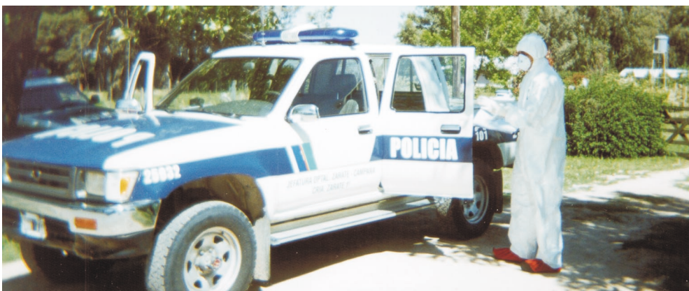
La Policía de la Provincia de Buenos Aires participa en el control de los accesos que se practican durante los simulacros.

En caso de accidente nuclear un funcionario designado por la ARN será el Jefe Operativo de la Emergencia, a quien deberán responder los representantes de la entidad explotadora de la central nuclear, las organizaciones civiles y las fuerzas de seguridad de la zona afectada, conforme a lo establecido en el artículo 16, inciso o de la Ley N° 24.804 y su decreto reglamentario.