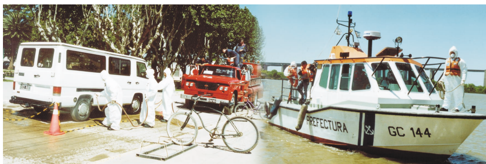
Organizaciones civiles y Fuerzas de seguridad participan conjuntamente en los Simulacros de emergencias, dirigidos por la ARN.