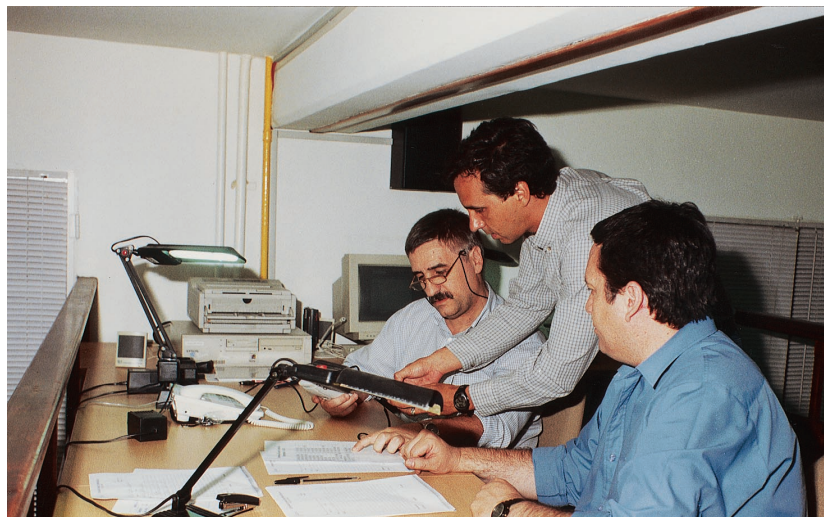
Centro de comunicaciones de Emergencias