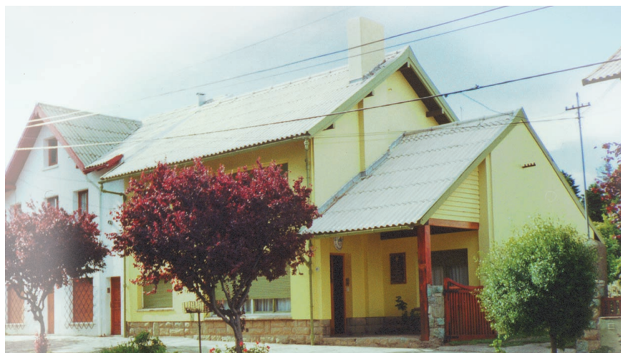
Sede de la Delegación Regional de la ARN en la ciudad de San Carlos de Bariloche.

La Delegación Regional Sur tiene su sede en la ciudad de San Carlos de Bariloche, calle Elfein N° 471.