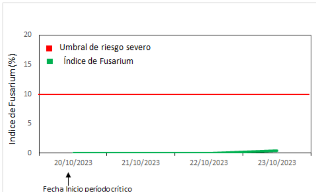
Salida gráfica de Índice de Fusarium para Azul.

En la salida gráfica se observa la evolución del Índice de Fusarium a partir del 20/10 y un pequeño incremento del mismo (IF: 0,4) el día 23/10 producto de condiciones ambientales conducentes.