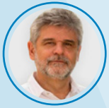
Ministro de Ciencia, Tecnología e Innovación, Lic. Daniel Filmus

“Es un honor para mí distinguir la excelencia académica y científica a través de los Premios RAICES los cuales significan un acercamiento y una vinculación constante con nuestros investigadores argentinos en el exterior.