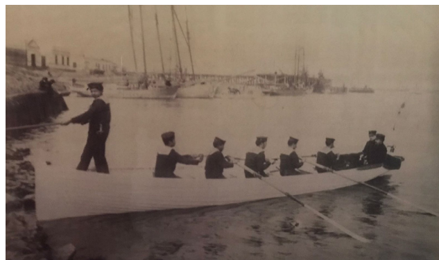
Subprefectura Santa Fe - año 1890.

Temas asociados: automóviles, motocicletas, poblamiento de zonas rurales, Estado argentino, jurisdicciones, policía, navegación, bomberos, provincias argentinas.