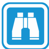
avistamiento de fauna / flora