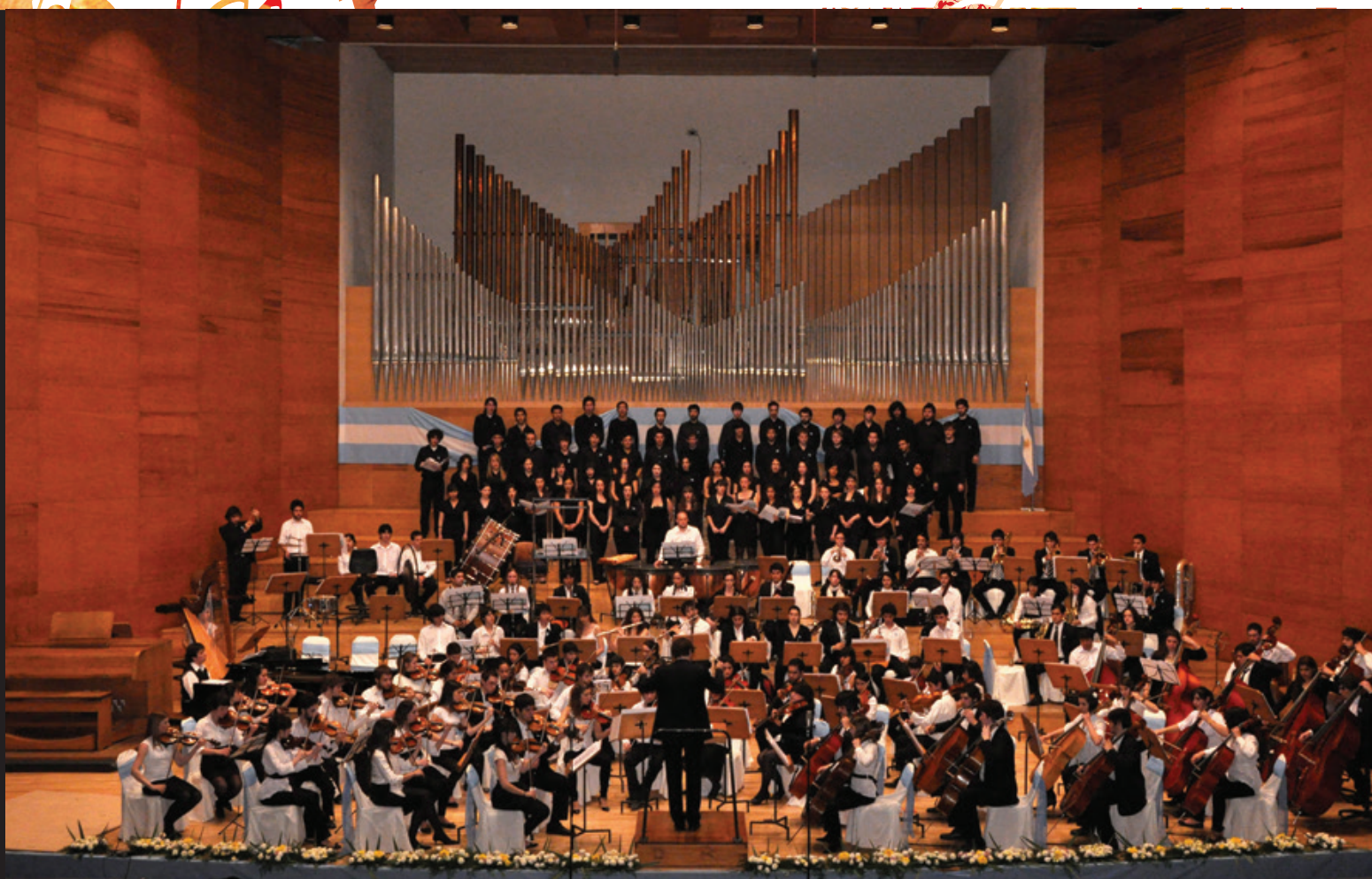
Concierto de la Orquesta y el Coro Nacional y Juvenil del Bicentenario. Auditorio Juan Victoria, Ciudad de San Juan.

La Orquesta y el Coro Juvenil del Bicentenario fue creada en el año 2010 por el Ministerio de Educación de la Nación con el propósito de profundizar las políticas educativas llevadas adelante y celebrar un nuevo aniversario de la Patria a través de esta experiencia artística. La agrupación musical está integrada por jóvenes músicos de todo el país quienes recorrieron las distintas regiones argentinas presentando un variado repertorio sinfónico-coral.