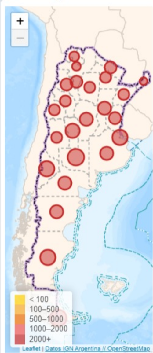
Confirmados por cada 100.000 habit...