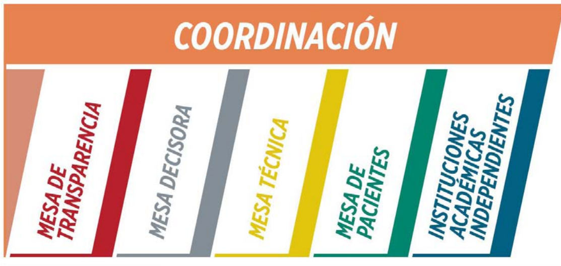
Figura 1: Estructura de la CONETEC