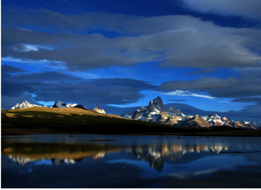
Glaciares en el cerro Torre y monte Fitz Roy o Chaltén